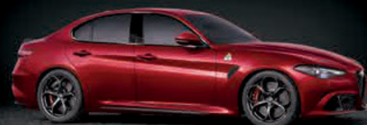
362 - ROJO COMPETIZIONE