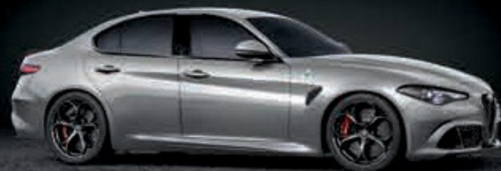
620 - GRIS SILVERSTONE