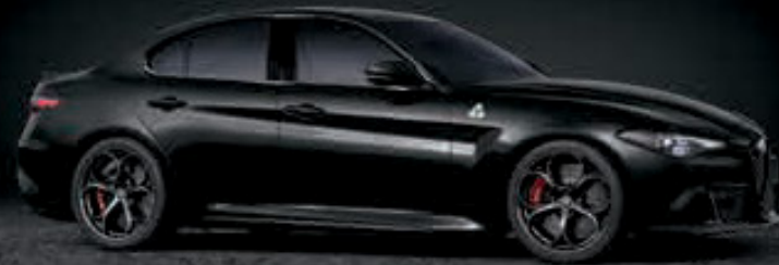
408 - NEGRO VULCANO