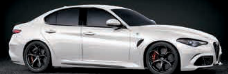
248 - BLANCO TROFEO