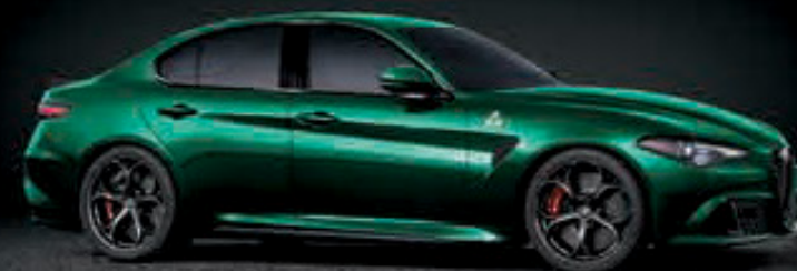
646 - VERDE MONTREAL