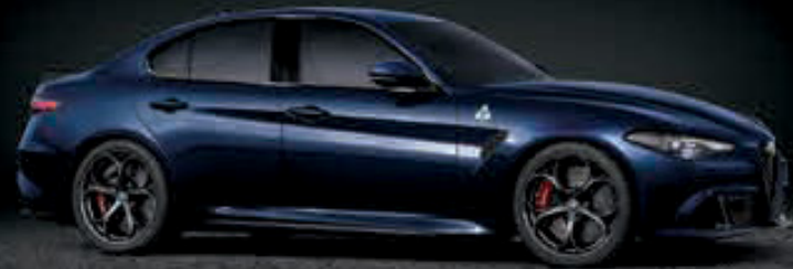
092 - AZUL MONTECARLO