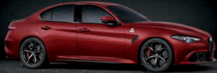
414 - ROJO ALFA