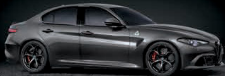
035 - GRIS VESUVIO